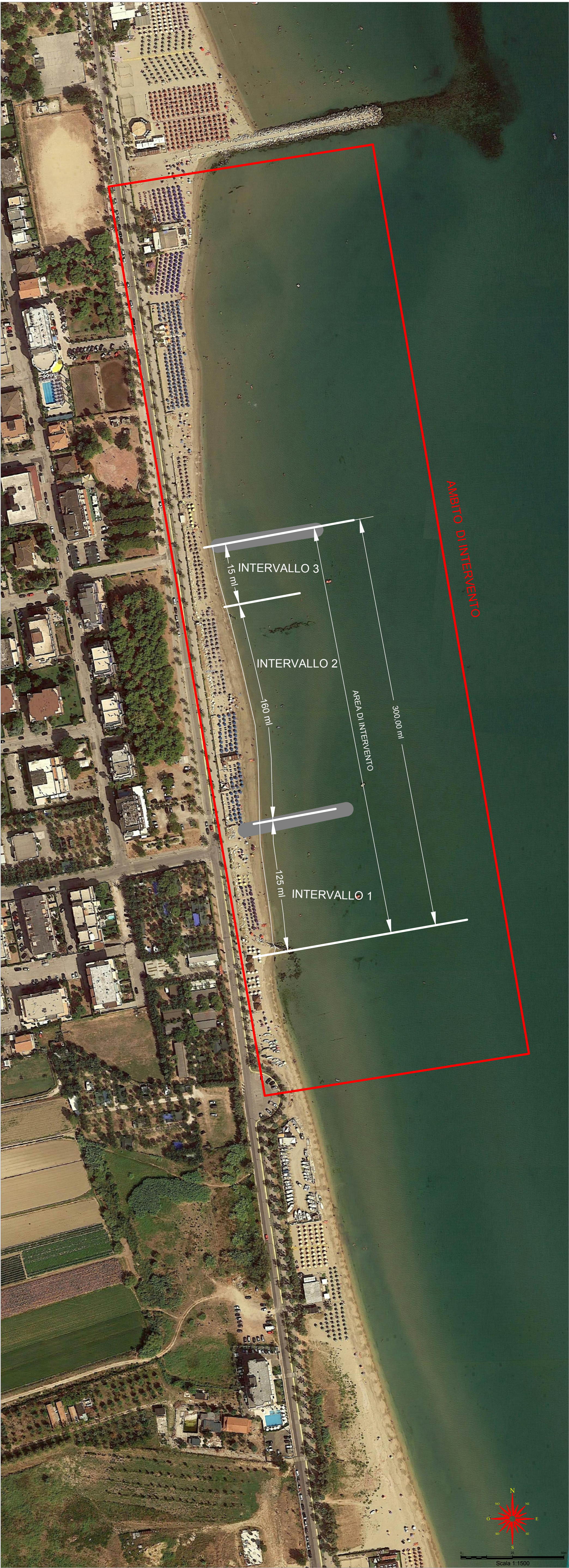
INTERVENTO DI MARTINSICURO 2