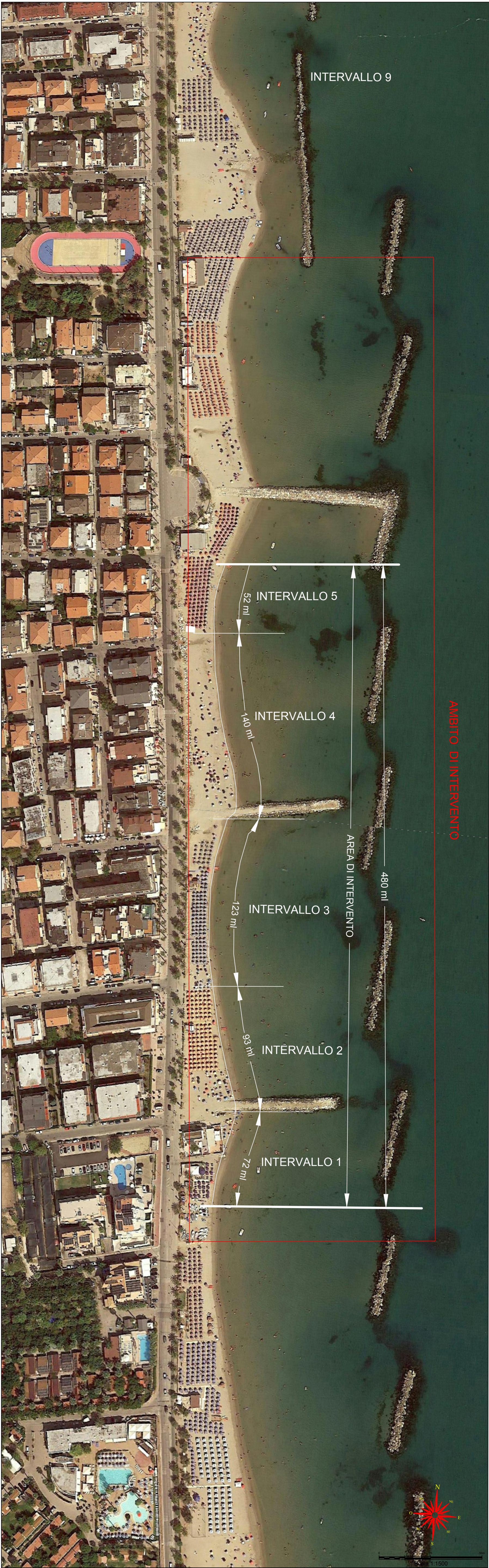
INTERVENTO DI MARTINSICURO 1